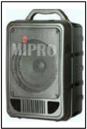
IMAGEN REF. DESCRIPCIÓN P.V.P.R.

MA 705 PA ..... Sistema amplificado autónomo con baterías recargables. 70 W R.M.S. Sistemas UHF inalámbricos opcionales ..... € 391,00