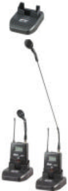
IMAGEN REF. DESCRIPCIÓN P.V.P.R.

MD101/MM202 ..Conjunto compuesto por base para alojar transmisores de petaca y micrófono de conferencias de tallo largo o corto. El micrófono puede alojarse en el conector Mipro estándar MJ40S..... € 132,00