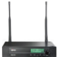
IMAGEN REF. DESCRIPCIÓN P.V.P.R.